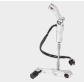
Quick Shifter Pedal 08U70-MKK-D00 €731

Για να αλλάξετε ταχύτητες με τον παραδοσιακό τρόπο. Δουλεύει παράλληλα με τους διακόπτες τιμονιού. Μόνο για τα DCT μοντέλα.