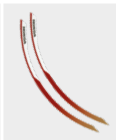
Wheel Sticker Sets - Αυτοκόλλητο τροχού 08F70-MJP-F50ZA 53€ Για αγωνιστική εμφάνιση, αυτοκόλλητο από 3-τεμάχια και είναι διαθέσιμο σε κόκκινο Victory Red *R334*