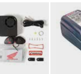
Honda Optimate 5 Battery Optimizer 08M51-EWA-801E € 117 Ο νέος φορτιστής μπαταρίας Honda Optimate 5 φορτίζει σωστά και συντηρεί την μπαταρία του δικύκλου.