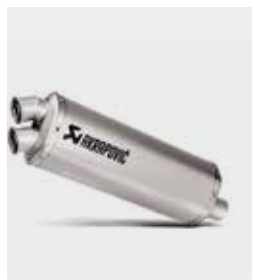
Akrapovic Muffler - Εξάτμιση 08F88-MKK-002