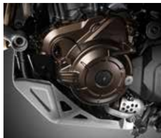
DCT Shifter Pedal 08U70-MJP-G80 - Αλλαγή ταχυτήτων Ποδιών (DCT) € 399

Τιμές, κωδικοί και χαρακτηριστικά ενδέχεται να αλλάξουν χωρίς προειδοποίηση. Στις τιμές δεν συμπεριλαμβάνεται το κόστος τοποθέτησης. Παρακαλώ επικοινωνήστε με το τοπικό εμπόρο για την τελική τιμή, διαθεσιμότητα και συμβουλές τοποθέτησης.