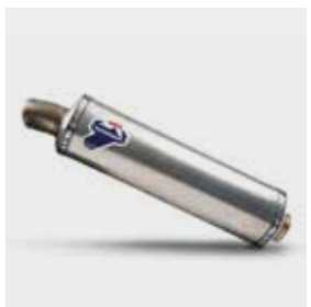
Termignoni Muffler - Εξάτμιση 08F88-MKK-001 Απο ανοξείδωτο ατσάλι, παρέχει: - Σημαντική μείωση βάρους 2.47kg (standard silencer is 4.8Kg) - Αύξηση στην ιπποδύναμη +1:53 hp at 5,920 r/min, - και ροπή +2.67 Nm at 2,850 r/min

Μετρώντας την πίεση στο μοχλό ταχυτήτων, το σύστημα αυτό επιτρέπει την αλλαγή σχέσεων ταχυτήτων χωρίς την ανάγκη ο αναβάτη να κάνει χρήση της μανέτας συμπλέκτη ή του γκαζιού. Το σύστημα υποστηρίζει και το ανέβασμα αλλά και το κατέβασμα σχέσεων. Μόνο για τα μηχανικά μοντέλα.